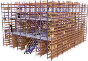
PLATEFORMES SUR RAYONNAGES