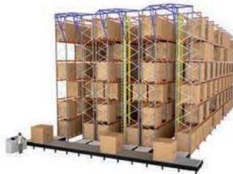
SYSTÈME AUTOMATIQUE PALETTES