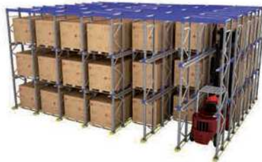
AR DRIVE IN