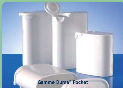
Gamme Duma® Pocket