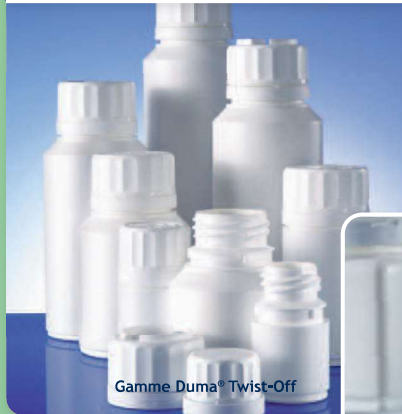
Gamme Duma® Twist-Off