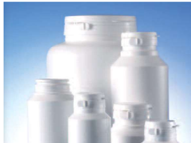
Gamme Duma® Standard