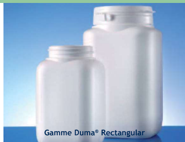
Gamme Duma® Rectangular