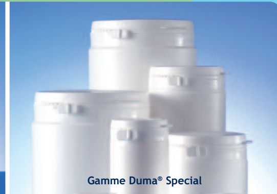
Gamme Duma® Special