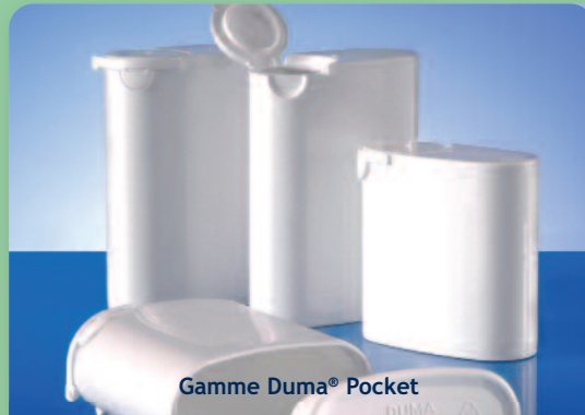
Gamme Duma® Pocket