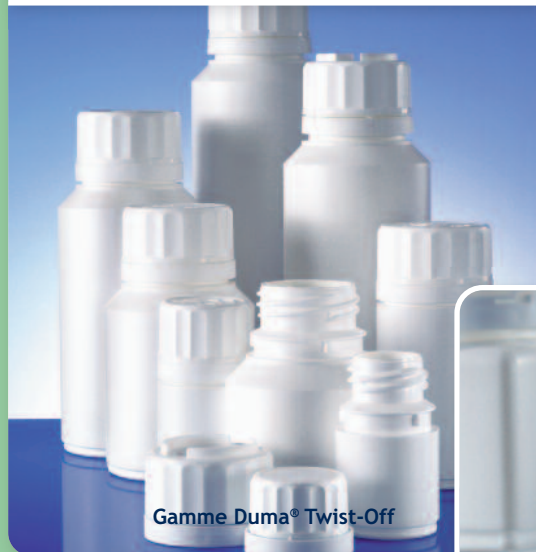
Gamme Duma® Twist-Off