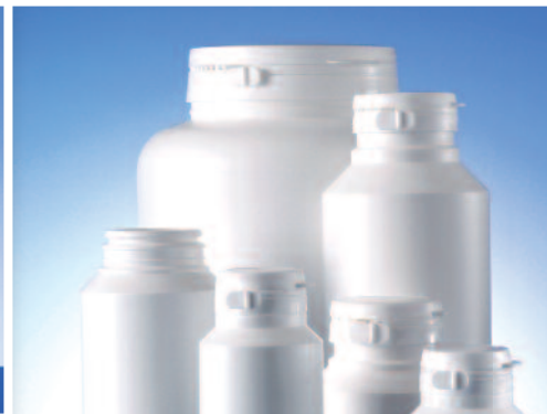
Gamme Duma® Standard