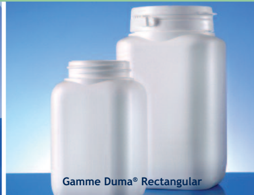
Gamme Duma® Rectangular