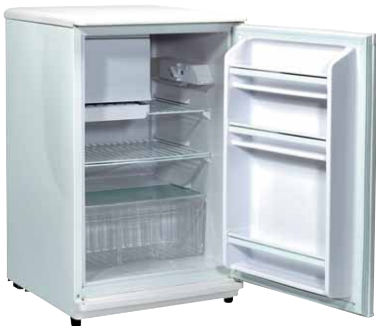
Réfrigérateur 106 L