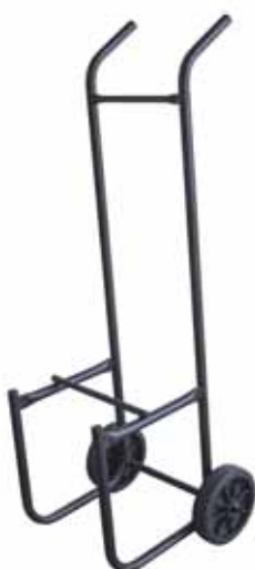
Option possible : Diable porte-chaises