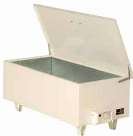
CHAUFFE GAMELLES CG10/12

Tous répondent aux Normes de conformité CE.