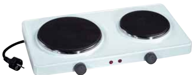
RÉCHAUD ÉLECTRIQUE RE1