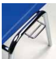
Option pour CCP et CC/B