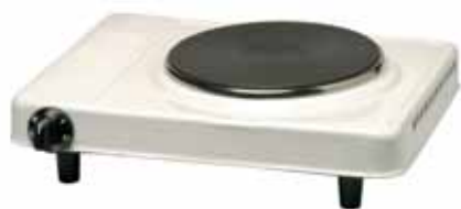
RÉCHAUD ÉLECTRIQUE RE